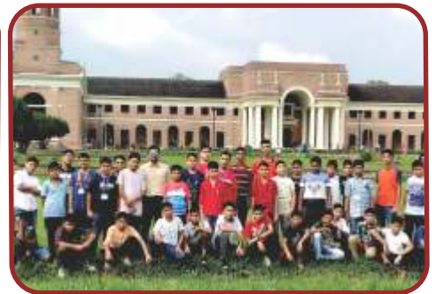
वन अनुसंधान केन्द्र, देहरादून