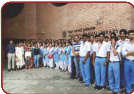
विक्रम साराभाई पुस्तकालय, अहमदाबाद