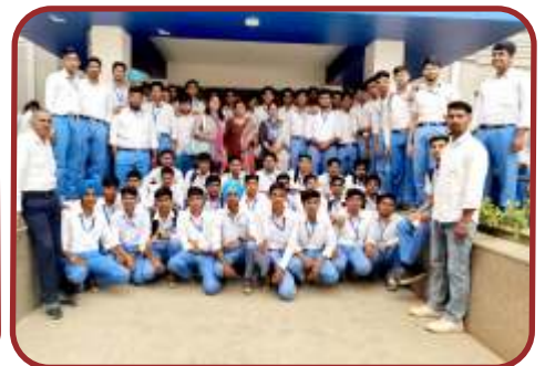
श्री विश्वकर्मा कौशल विश्वविद्यालय, गुरुग्राम