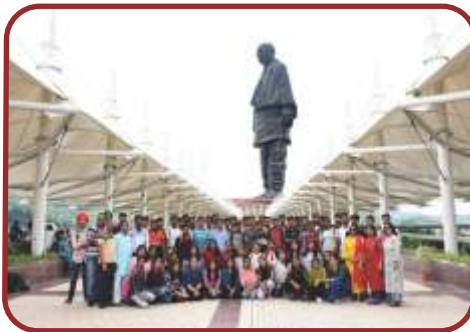
स्टैच्यू ऑफ यूनिटी (गुजरात)