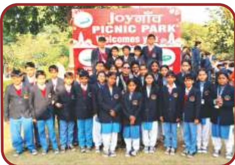
जॉय गाँव पिकनिक पार्क, झज्जर