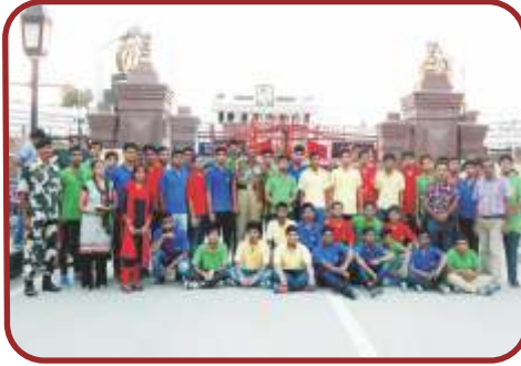
अटारी बॉर्डर (पंजाब)