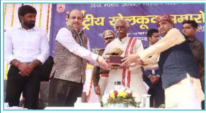
20 नवम्बर 2022 को राष्ट्रीय खेलकूद समारोह के उद्घाटन अवसर पर हरियाणा के राज्यपाल श्री बण्डारू दत्तात्रेय जी