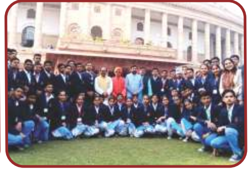
संसद भवन, नई दिल्ली