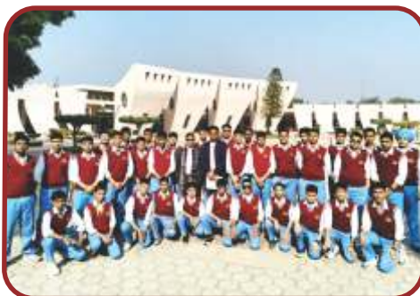
पुष्पा गुजराल साईंस सिटी, कपूरथला