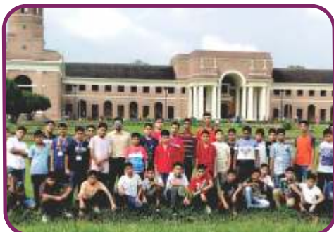
वन अनुसंधान केन्द्र, देहरादून