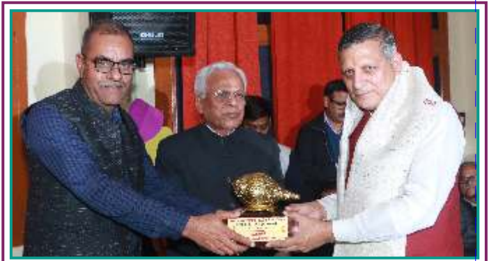
21 नवम्बर, 2022 को सांस्कृतिक संध्या के अवसर पर हरियाणा के शिक्षामंत्री श्री कंवर पाल गुर्जर