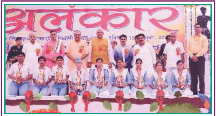
विद्यालय के 44वें वार्षिकोत्सव के अवसर पर तत्कालीन राज्यपाल कप्तान सिंह सोलंकी एवं तत्कालीन न्यूज एडिटर श्री रोहित सरदाना (पूर्व छात्र)