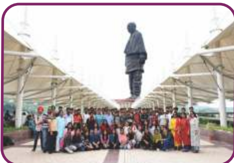
स्टैच्यू ऑफ यूनिटी (गुजरात)