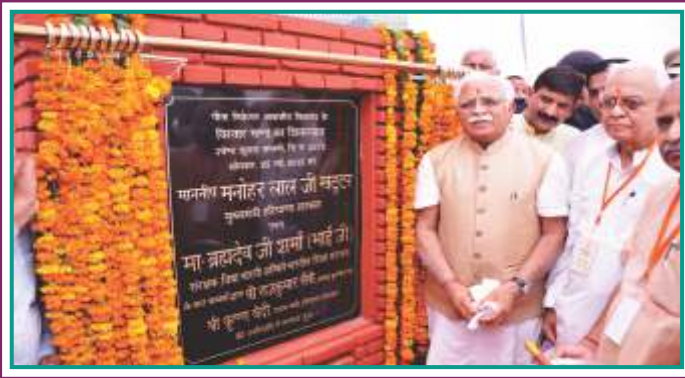
25 मई 2015 को विद्यालय के विस्तार खण्ड का शिलान्यास करते हुए हरियाणा के मुख्यमंत्री श्री मनोहर लाल