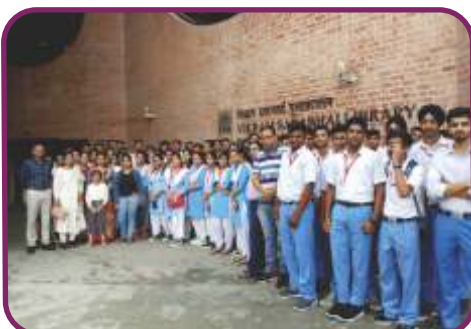
विक्रम साराभाई पुस्तकालय, अहमदाबाद