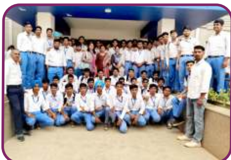
श्री विश्वकर्मा कौशल विश्वविद्यालय, गुरुग्राम