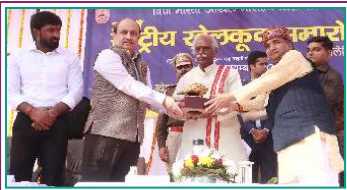
20 नवम्बर 2022 को राष्ट्रीय खेलकूद समारोह के उद्घाटन अवसर पर हरियाणा के राज्यपाल श्री बण्डारू दत्तात्रेय जी