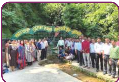
सरस्वती नदी उद्गम स्थल, आदिबुद्री