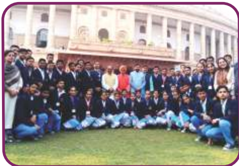
संसद भवन, नई दिल्ली