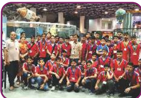
पुष्पा गुजराल साईंस सिटी, कपूरथला