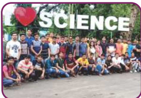
साईंस सिटी, मुम्बई