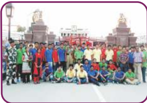
अटारी बॉर्डर (पंजाब)