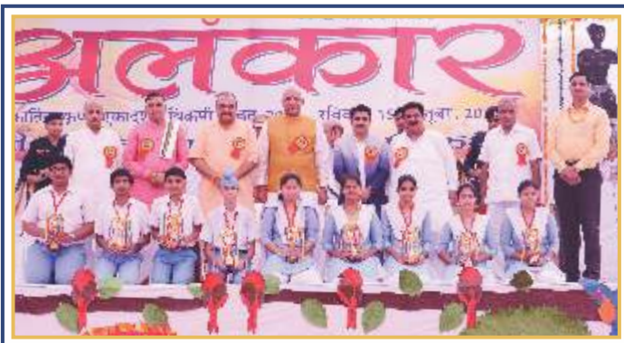
विद्यालय के 44वें वार्षिकोत्सव के अवसर पर तत्कालीन राज्यपाल कप्तान सिंह सोलंकी एवं तत्कालीन न्यूज एडिटर श्री रोहित सरदाना (पूर्व छात्र)