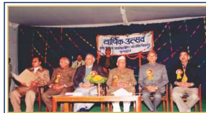
21 जनवरी 2001 विद्यालय के वार्षिक उत्सव में उपस्थित तत्कालीन केन्द्रीय नागरिक उड्डयन मंत्री श्री चमन लाल गुप्ता