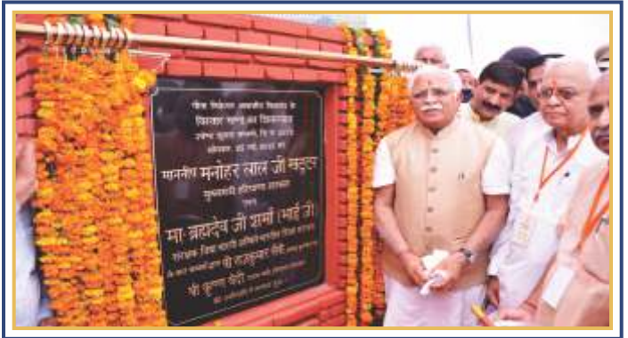
25 मई 2015 को विद्यालय के विस्तार खण्ड का शिलान्यास करते हुए हरियाणा के मुख्यमंत्री श्री मनोहर लाल