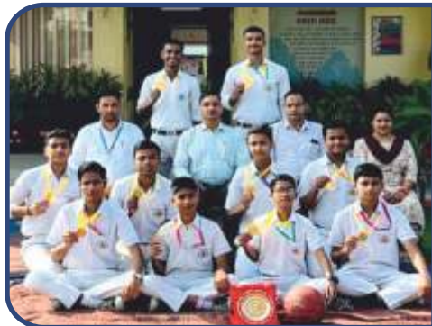
U-17 Basketball Qualified for SGFI

Everyday yoga sessions in the morning assembly help the children in multi faceted ways. We have got a spacious hall called 'Yog Sadan', built for this specific purpose.