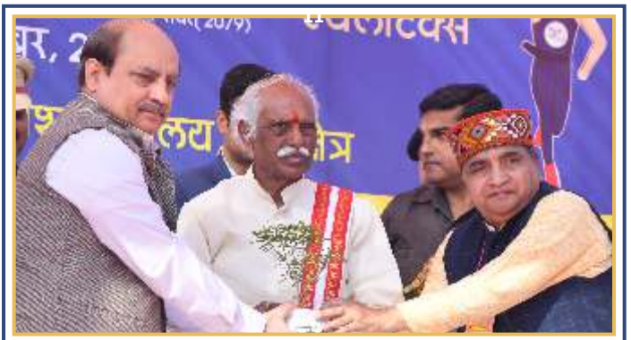
20 नवम्बर 2022 को राष्ट्रीय खेलकूद समारोह के उद्घाटन अवसर पर हरियाणा के राज्यपाल श्री बण्डारू दत्तात्रेय जी