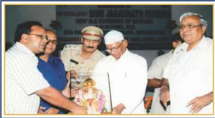
10 अक्टूबर 2010 को राज्य स्तरीय योग प्रतियोगिता के अवसर पर हरियाणा के तत्कालीन राज्यपाल श्री जगन्नाथ पहाड़िया जी