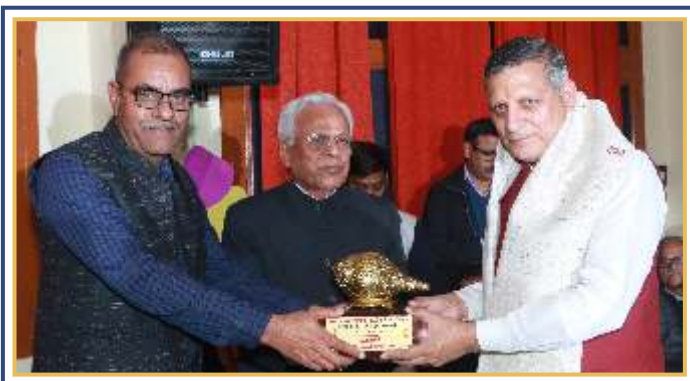
21 नवम्बर, 2022 को सांस्कृतिक संध्या के अवसर पर हरियाणा के शिक्षामंत्री श्री कंवर पाल गुर्जर