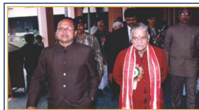
25 जनवरी 2005 को राष्ट्रीय विज्ञान मेले के समापन अवसर पर तत्कालीन मानव संसाधन विकास मंत्री डॉ० मुरली मनोहर जोशी