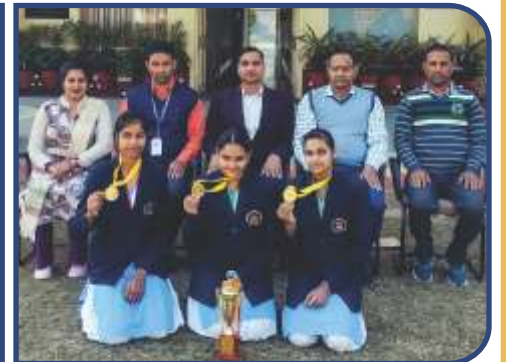
U-17 Rope Skipping Qualified for SBF