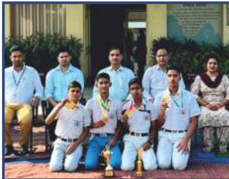
U-17 Malkhamb Qualified for SGFI