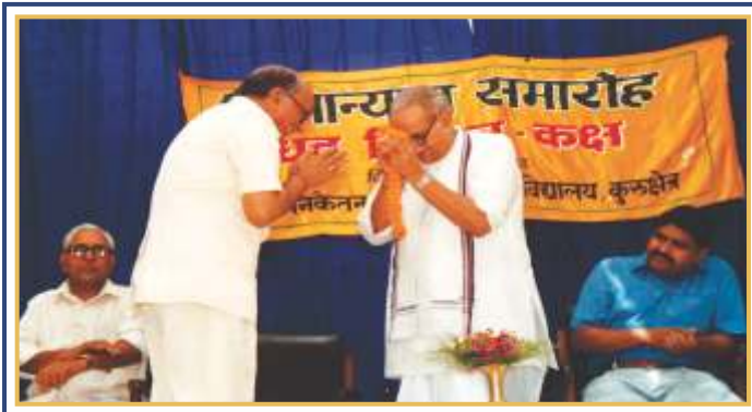
9 मई 1993 विद्यालय के विशाल कक्ष के शिलान्यास के अवसर पर उपस्थित राष्ट्रीय स्वयं सेवक संघ के चतुर्थ सरसंघचालक, प्रो० राजेन्द्र सिंह (रज्जू भैया)